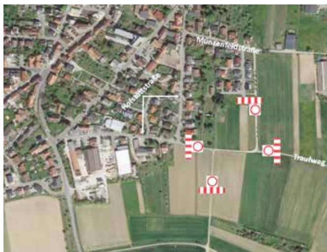
Übersichtsplan Erschließungsmaßnahme Banntor-Gasse II

Zur Sicherung der Baustelle wird der komplette Bereich der Erschließungsarbeiten eingezäunt. Für die Durchführung der Arbeiten ist es notwendig, die in den Bereich des Gebiets führenden Feldwege für die Dauer der Maßnahme voll zu sperren und dort nur den Baustellenverkehr zuzulassen.