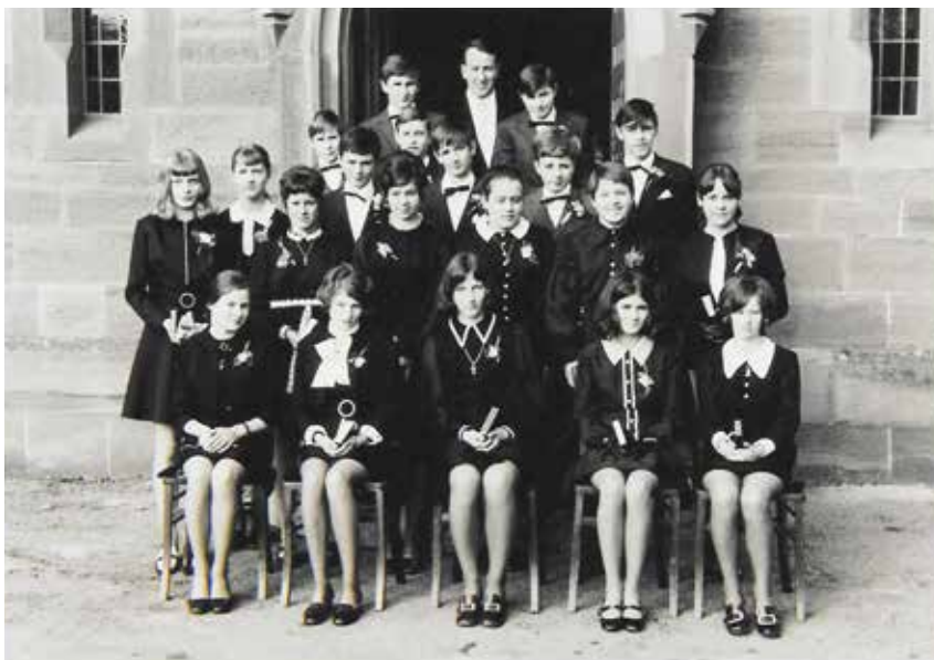
Die Konfirmanden von Wurmberg am 15.03.1970 und