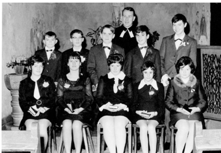
von Neubärental am 08.03.1970