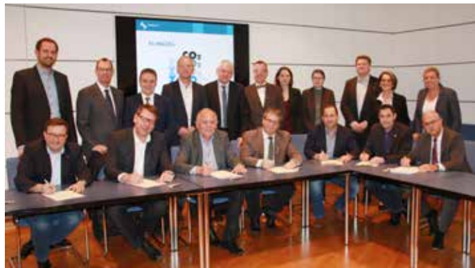
Wollen ihrer Vorbildfunktion gerecht werden und den Klimaschutzpakt Baden-Württemberg stärken: 14 Verwaltungschefs haben mit ihrer Unterschrift ein deutliches Signal für den Klimaschutz auf kommunaler Ebene gesetzt.