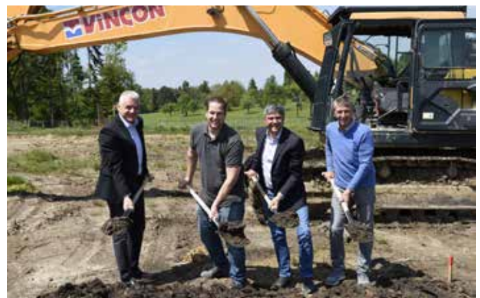
Spatenstich zum Neubau Fa. Eberle Medizintechnik

Am 23. Mai 2019 erfolgte der Spatenstich für das neue Gebäude der Firma Eberle Medizintechnik aus Neubärental im Gewerbegebiet Dachstein.