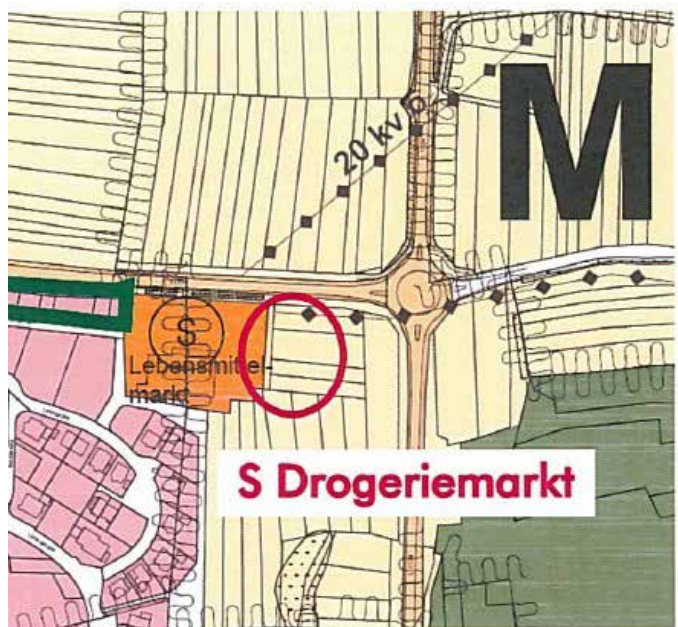
FNP Änderung Mönshausen

gez. Thomas Fritsch Verbandsvorsitzender