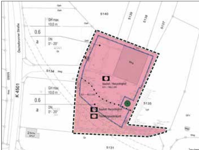
Kartenausschnitt Bei der Steingrube

Maßgebend ist der Lageplan des Bebauungsplanes in der Fassung vom 27.07.2017. Der Planbereich ist im folgenden Kartenausschnitt dargestellt: