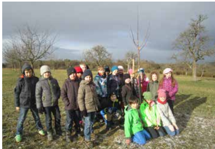
Die Klasse 4b der Grundschule Wurmberg