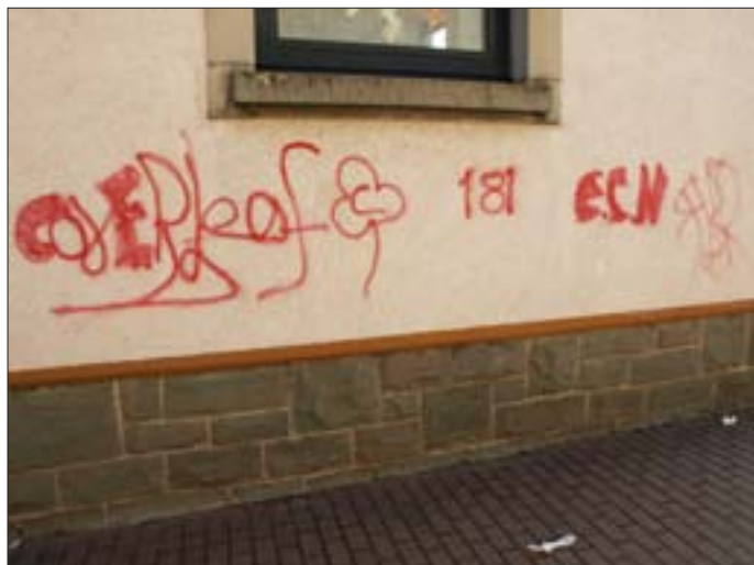
Graffiti am Schulhaus (Altbau)

Polizeiposten Niefern-Öschelbronn und Gemeindeverwaltung Wurmberg