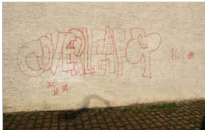
Graffiti am alten Feuerwehrhaus