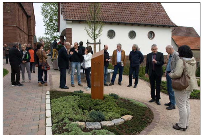
Großes Interesse bei den anwesenden Bürgerinnen und Bürgern